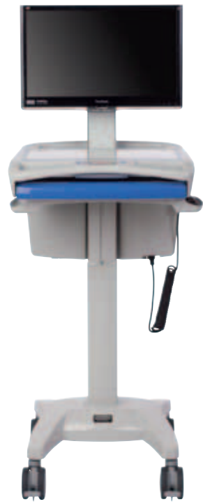
Configuration unité centrale