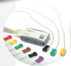
BOÎTIER D'ACQUISITION SANS FIL